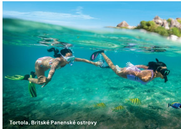
Tortola, Britské Panenské ostrovy

Zľava US $50 na prístav a exkurziu. Zľava je vždy pripísaná na 1. pasažiera v kabíne. Zahnutý je aj prístav vylodenia (v deň konca plavby). Zľava sa automaticky uplatní na 1. pasažiera v rezervácii, ak sú výlety na pobreží rezervované cez cestovnú agentúru, ncl.com alebo call centrum NCL. Ak si chcú pasažieri rezervovať výlety na pobreží, musí byť najprv potvrdená rezervácia plavby. Zľava US $50 bude automaticky prepočítaná na miestnu menu. Akékoľvek exkurzie na pobreží, ktoré v hodnote menej ako US $50, získajú 100% zľavu, čím sa cena zníži na nulu. Nevzťahujú sa na prenájmy na Great Stirrup Cay/Harvest Caye. Zahnutý nie je ani prístav nalodenia (v deň začiatku plavby). Zľava je neprenosná a nie je možné ju previesť len na niektorý prístav. Zľava môže byť použitá na viaceré exkurzie v rovnakom prístave.