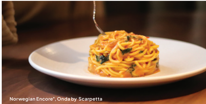
Norwegian Encore®, Onda by Scarpetta

Večera pozostáva max. z troch predjedál, jedného hlavného jedla (entrée) a z troch dezertov. Food Republic, Raw Bar, Pincho Tapas Bar, Nama, Sushi a Wasabi zahŕňajú 4 položky menu na osobu. Dodatočné hlavné jedlá a vybrané položky z menu podliehajú príplatku.