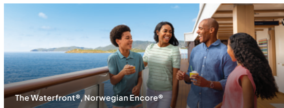
The Waterfront®, Norwegian Encore®

lba na vybraných plavbách. Prehľad plavieb nájdete na ncl.com/free-at-sea . Ak je v rezervácii kabíny 5 až 8 pasažierov, títo pasažieri budú platiť bežnú cenu.