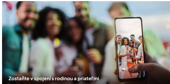
Zostaňte v spojení s rodinou a priateľmi

150 minút na osobu platné pre všetky plavby. Toto je sprístupnené prostredníctvom login-u, personalizovaného na pasažiera (jedno aktívne pripojené zariadenie v okamžiku) a je dostupný po celej lodi. Internet je dostupný na všetkých zariadeniach schopných pripojenia k Wi-Fi. Balíček neumožňuje streaming. Ďalšie zariadenia k dispozícii k dokúpeniu počas pobytu na lodi. Pre záujemcov sú v aplikácii Norwegian Cruise Line App / My NCL k dispozícii aj upgrade balíčky Wi-Fi na zakúpenie (najnovšie informácie nájdete na ncl.com/onboard-packages ).